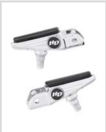
F. DEFIANCE FUSSRASTEN – CHROM