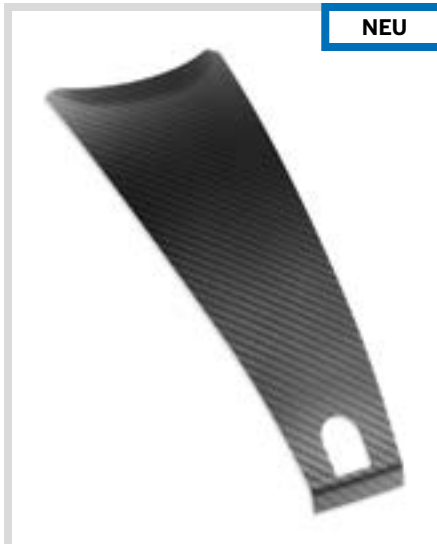
E. LIVEWIRE – TANKVERZIERUNG – KOHLEFASER