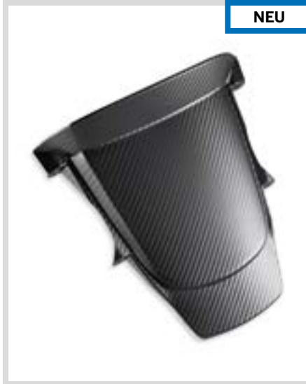
D. LIVEWIRE – BLADE FÜR DIE COCKPIT-VERKLEIDUNG – KOHLEFASER