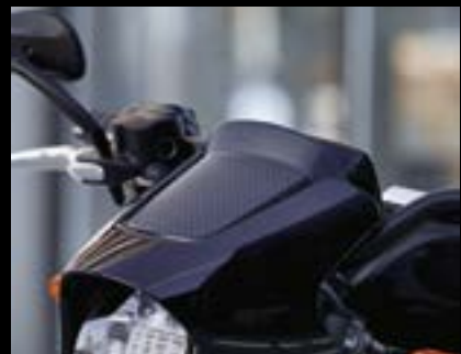
LiveWire – Blade für Cockpit-Verkleidung ..... S. 5