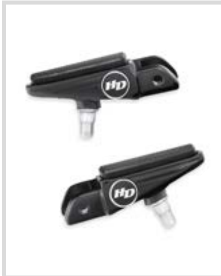
F. DEFIANCE FUSSRASTEN – SCHWARZELOXIERT