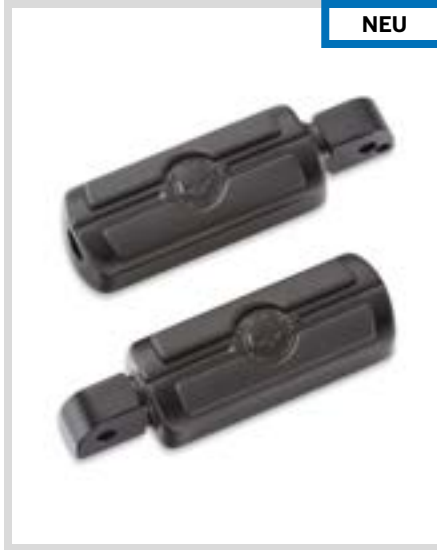
E. WILLIE G SKULL FUSSRASTEN – SCHWARZGLÄNZEND