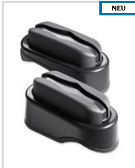
D. LIVEWIRE – RAHMENSCHÜTZER