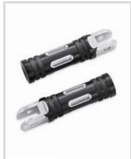
D. EDGE CUT COLLECTION FUSSRASTEN