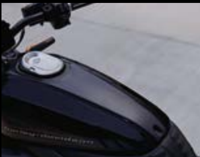
LiveWire Tankverzierung ..... S. 5