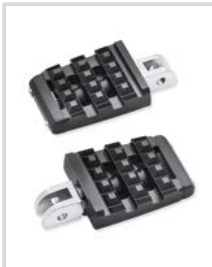
B. DOMINION KOLLEKTION FUSSRASTEN – BLACK