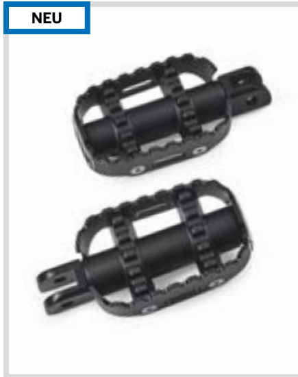
A. 80GRIT FUSSRASTEN – SCHWARZ