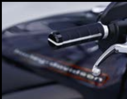
Voltaic Kollektion Lenkergriffe ..... S. 9