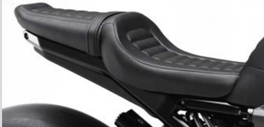
A. LIVEWIRE – NIEDRIGER SITZ