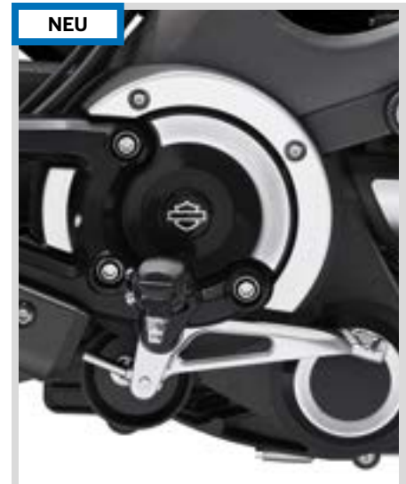
A. GETRIEBEZIERBLENDEN – SCHWARZ MIT AKZENTEN