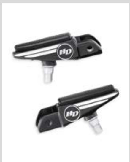
F. DEFIANCE FUSSRASTEN – MASCHINELL BEARBEITET