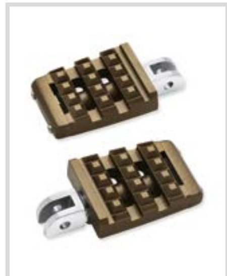
B. DOMINION KOLLEKTION FUSSRASTEN – BRONZE