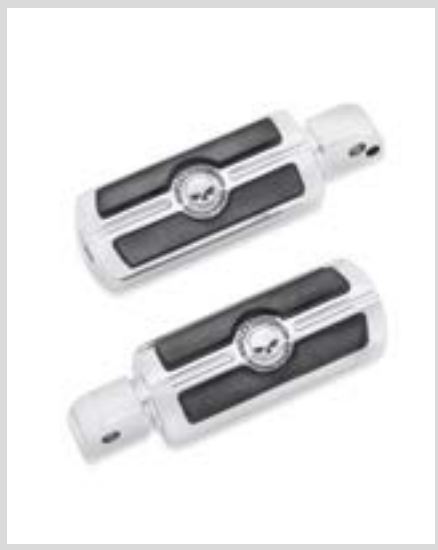
E. WILLIE G SKULL FUSSRASTEN – CHROM