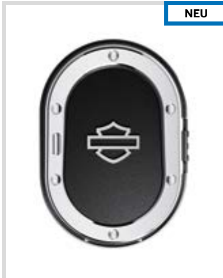
F. LIVEWIRE – DECKEL FÜR DIE LADEBUCHSE – SCHWARZ/MATTVERCHROMT