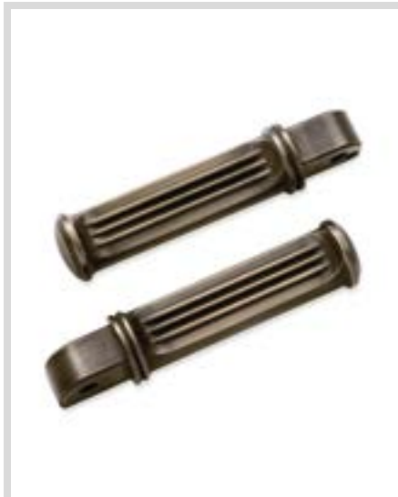
G. MESSING-KOLLEKTION FUSSRASTEN