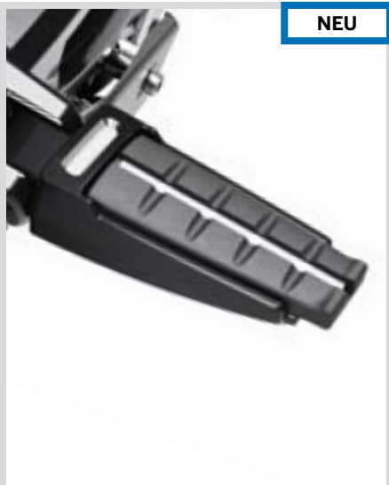
C. VOLTAIC FAHRERFUSSRASTEN