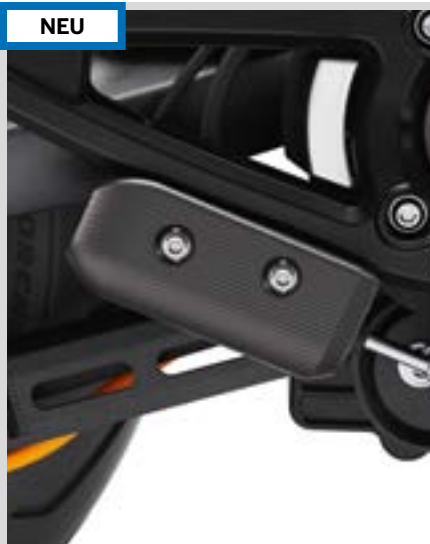
C. LIVEWIRE – ABDECKUNG DES HINTERRAD-HAUPTBREMSZYLINDERS – KOHLEFASER