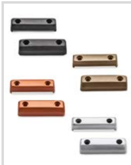
C. DOMINION KOLLEKTION FUSSRASTEN-ZIERTEILE