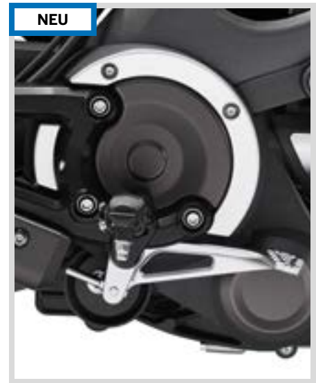
A. GETRIEBEZIERBLENDEN – KOHLEFASER