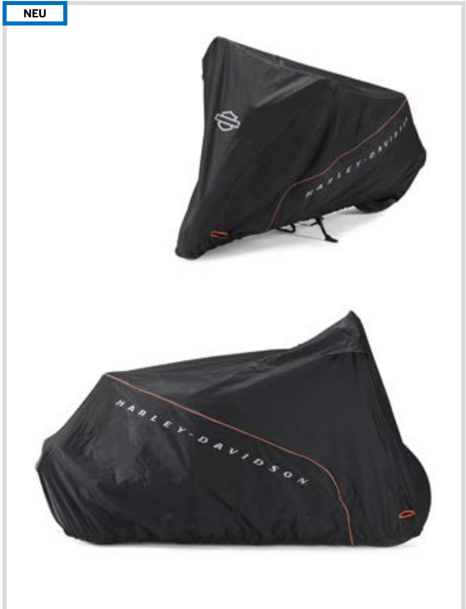
A. LIVEWIRE – ABDECKPLANE