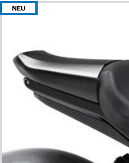
B. LIVEWIRE – HECKABSCHNITTVERKLEIDUNG – KOHLEFASER