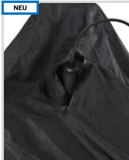
A. LIVEWIRE – ABDECKPLANE – LADEÖFFNUNG