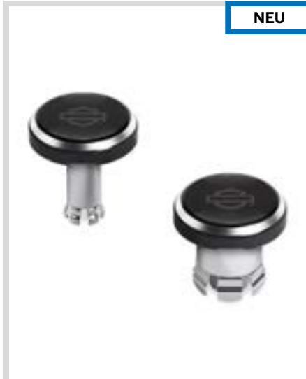
C. LIVEWIRE – MUTTERNKAPPEN FÜR HINTERACHSE – SCHWARZ MIT GEFRÄSTEN DETAILS