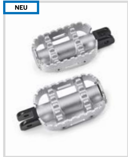
A. 80GRIT FUSSRASTEN – UNBEHANDELT