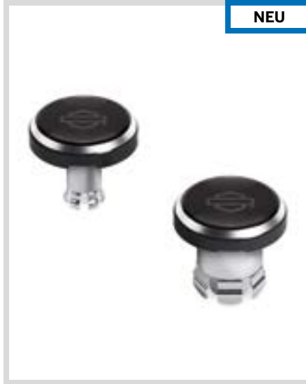
B. LIVEWIRE – MUTTERNKAPPEN FÜR VORDERACHSE – SCHWARZ MIT GEFRÄSTEN DETAILS