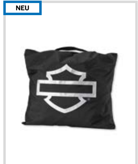
A. LIVEWIRE – ABDECKPLANE – INTEGRIERTE AUFBEWAHRUNGSTASCHE