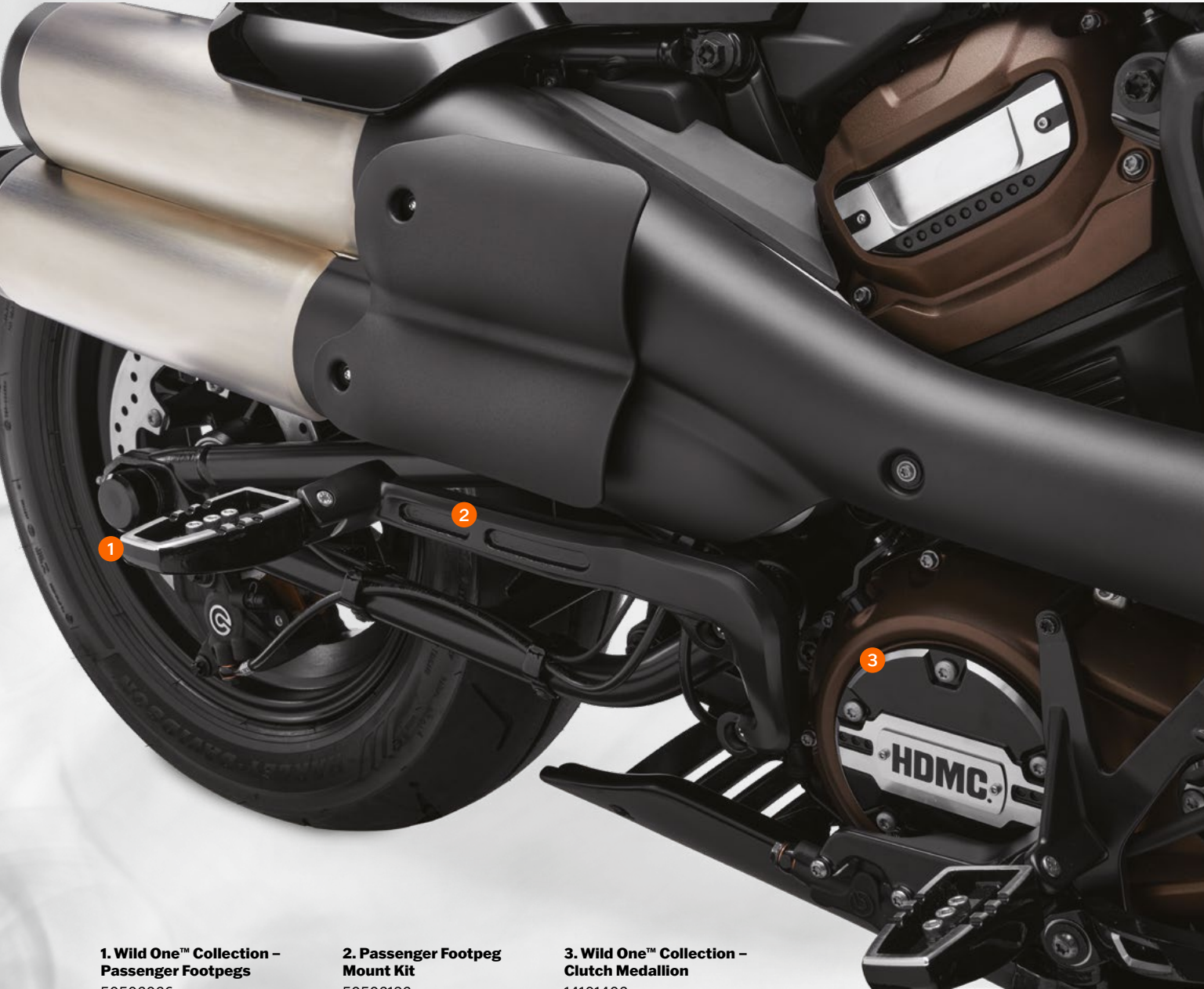
1. Wild One™ Collection – Passenger Footpegs 50502026